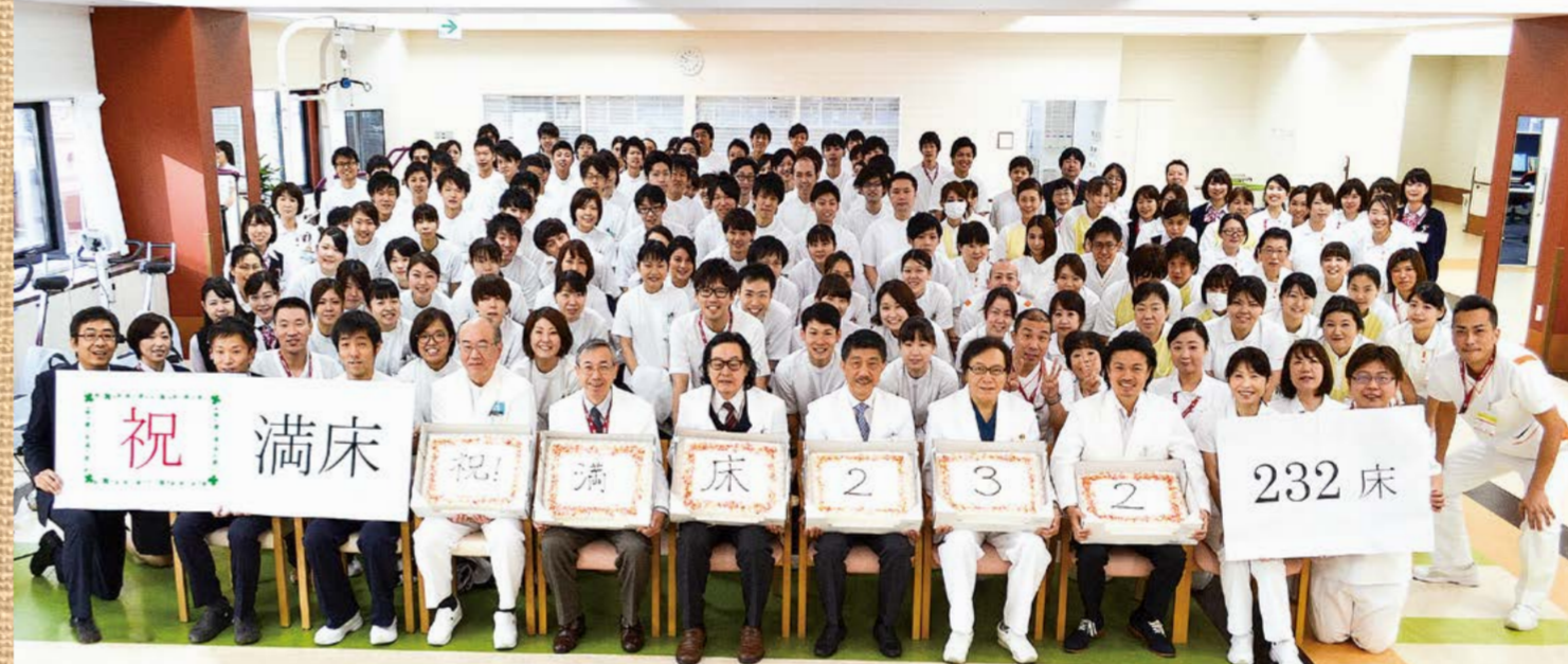
五反田リハビリテーション病院 平成27年12月1日