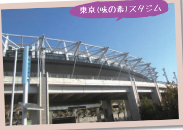
東京(味の素)スタジアム

調布には昨年話題にもなったラグビーワールドカップ、そして東京オリンピック競技(サッカー、ラグビー)会場にもなっている「東京(味の素)スタジアム」があります。残念ながら地元開催の競技チケットには落選してしまいましたが、雰囲気だけでも感じられたらと思っています。皆様も是非、調布市に足を運んでみてはいかがでしょうか。