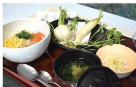
1/7は七草をつかった菜飯を