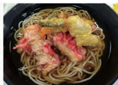
天ぷらそばは麺類の中でも特に好評